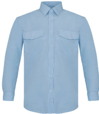
REF. P19-CE Color ■ CELESTE