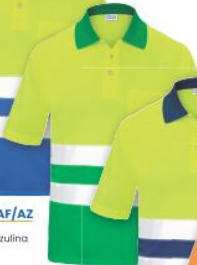
REF. 3016CM-AF/VE Color ■ ■ Amarillo flúor/Verde