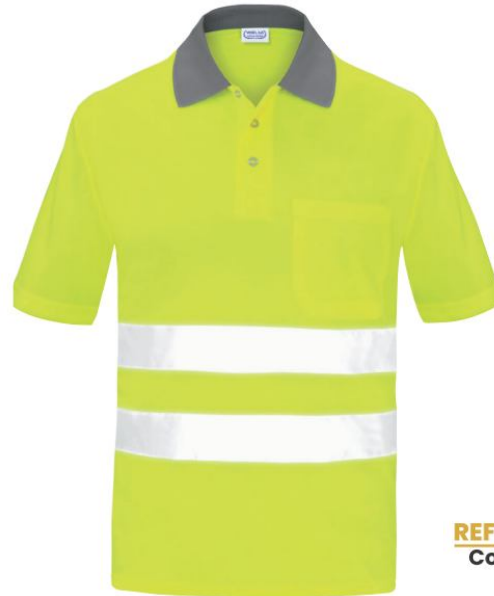
REF. 3009CM-AF Color ■ Amarillo flúor