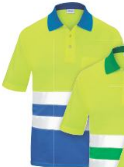
REF. 3016CM-AF/AZ Color ■ ■ Amarillo flúor/Azulina